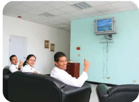
Hospital Santo Tomás

▀▀ Servicios de cortesía de Televisión por Cable e Internet: otorgados por Cable Onda a organizaciones educativas, sociales y de salud, entre otras.